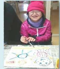
第2ふれあい工房を拠点に、休日クラブを偶数月に1回開催