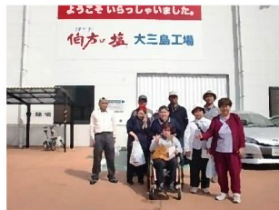
余暇支援(大三島への旅行)