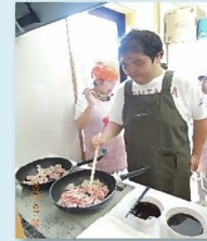
第2ふれあい工房にて、料理教室を奇数月に1回開催