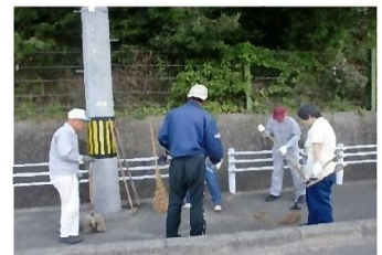
地域での清掃活動